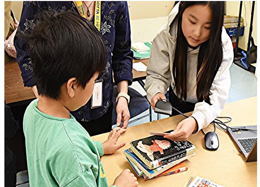
本を借りる児童と中学生ボランティア

毎週土曜、本校の図書室は小さいながらもたいへんなにぎわいです。小学部各学年の子どもたちが入れ替わり立ち替わり図書室を訪れます。子どもたちは楽しそうに本を選び、夢中で読みふけります。また、本校事務職員とともに、保護者ボランティアの方々も図書室の運営に関わっています。昼休みには、中学生ボランティアも活躍しています。日本語による読書環境を大切